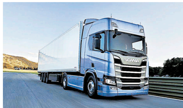
Un camión circulando por una carretera española.

Los afectados en Castilla y León por el cártel europeo de fabricantes de camiones han presentado ya 1.330 demandas que implican a más de 3.497 camiones adquiridos con sobreprecio entre los años 1997 y 2011. Estos expedientes son gestionados por el despacho CCS Abogados, que se encarga en España de unas 7.300 reclamaciones de 4.500 clientes por más de 34.000 vehículos. En ese sentido, fuentes del bufete explicaron que las pruebas periciales permiten calcular que la indemnización estipulada sobre el precio original de compra por camión, en el ciclo de 14 años del cártel (y sin tener en cuenta el interés legal del dinero desde la fecha de compra de cada vehículo), podría situarse en torno a una media del 16,35