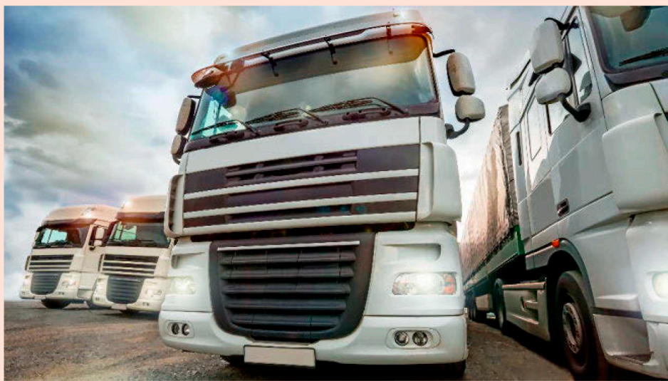
Las reclamaciones se dirigen contra Volvo-Renault, Iveco, Daf, Man y Daimler-Mercedes.

En España, la Confederación Española de Transporte de Mercancías (CETM) inició hace dos años un proceso para seleccionar un bufete que representara a sus asociados. El elegido fue CCS que, tras desarrollar una platafor-